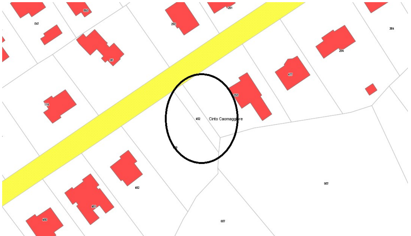
Estratto di mappa